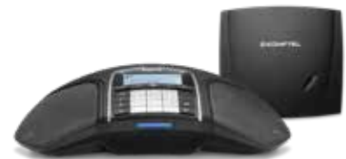
KONFTEL 300Wx ANALOG

Artikelnummer: 951101078 / 854101078 (US)