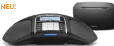
KONFTEL 300Wx IP

Konftel 300Wx in Kombination mit Konftel IP DECT 10 gehört zu einer unserer beliebtesten Lösungen. Nun ist dieses Konferenztelefon auch als Bundle erhältlich. Es ermöglicht schnurlose Telefonkonferenzen in HD-Qualität für Ihre IP-Telefonie (SIP). Auf jeder IP DECT-Basisstation können bis zu 20 Konftel 300Wx-Einheiten registriert werden und fünf Gespräche gleichzeitig stattfinden.